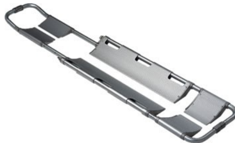
Barella a cucchiaio