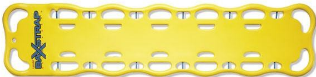
Barella (o tavola) spinale